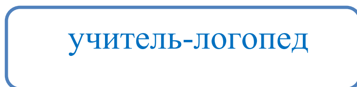
Схема взаимодействия учителя-логопеда с педагогами, работающими с детьми с ОВЗ с ТНР

В начале учебного года в течение двух недель учитель-логопед проводит логопедическое обследование (по традиционной методике) всех сторон речи детей. По итогам логопедического обследования учителем-логопедом составляется перспективный план индивидуальной коррекционно-развивающей работы с каждым ребёнком, в который по необходимости включены мероприятия не только по коррекции звукопроизносительной стороны речи, формирования грамматического строя речи, но и по развитию психологической базы речи. Совместно с воспитателями проводится диагностика познавательно-речевого развития детей путём наблюдения за детьми и бесед с ними. Результаты логопедического обследования и педагогической диагностики учитываются всеми педагогами группы при составлении индивидуальных образовательных маршрутов (ИОМ), перспективных планов работы с детьми, а также при выборе средств, методов и приёмов работы с детьми на занятиях и в совместной деятельности. Учитель-логопед организует работу всех участников образовательного процесса (см. схему )